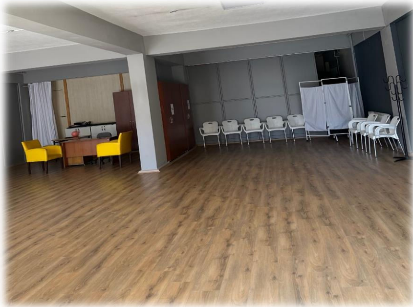
THO & Pilates Salonu