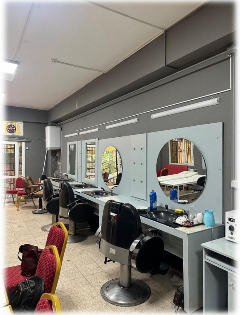
Güzellik ve Cilt Bakım Salonu