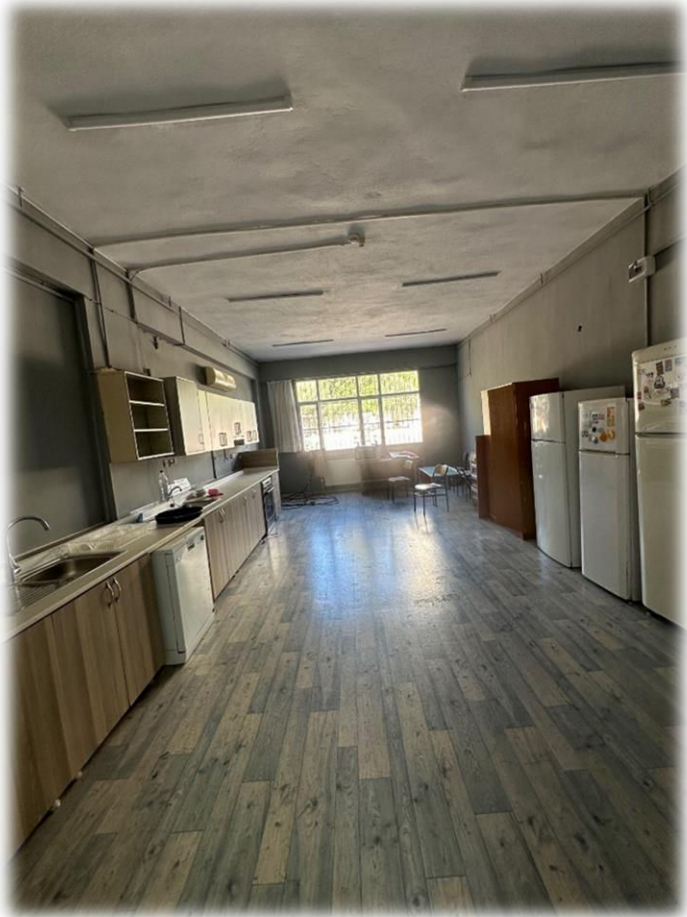
Yiyecek İçecek Atölyesi